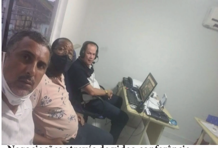
Negociações através de video conferência