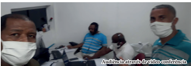
Audiência através de vídeo conferência

Como se já não bastassem às dificuldades já impostas pelo momento complicado e difícil, ainda tivemos que enfrentar o desrespeito das empresas para com os trabalhadores. No entanto, mesmo com as portas fechadas de março a agosto conforme indicação da OMS para conter a disseminação da doença, o SINDISAÚDE não parou as suas atividades. Travamos ainda uma grande batalha contra os constantes atrasos no pagamento de salários e benefícios, como 13º e férias. Mobilizamos os trabalhadores e em protesto a esta vergonhosa situação paralisamos as atividades em diversas unidades da capital baiana e também do interior.