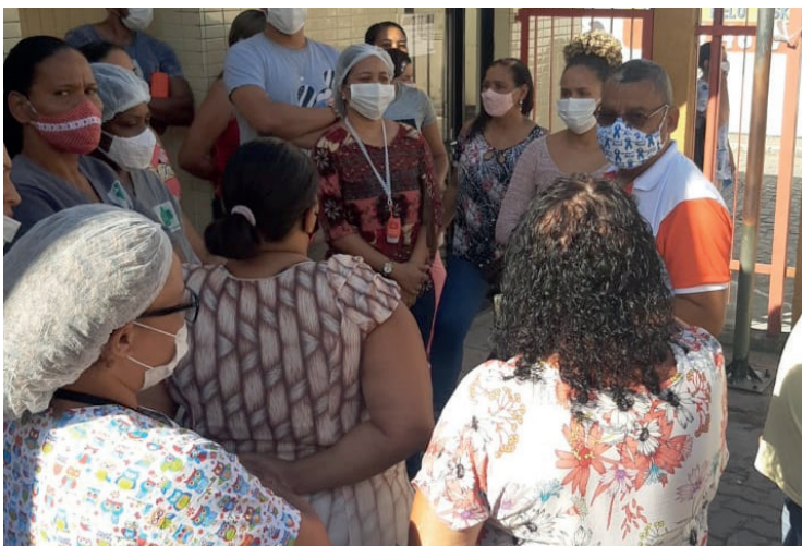
Ex-Trabalhadores da S3 Madre Deus

Nem mesmo as limitações impostas pelo distanciamento social foram capazes de paralisar a atuação do sindicato. A entidade se manteve lutando diligentemente para pôr fim aos atrasos de salários e benefícios (como 13º e férias). Houve várias manifestações em frente a unidades da capital, bem como do interior. Os atos muitas vezes foram notícia na imprensa local.