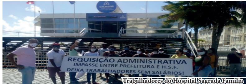
Trabalhadores do Hospital Sagrada Família