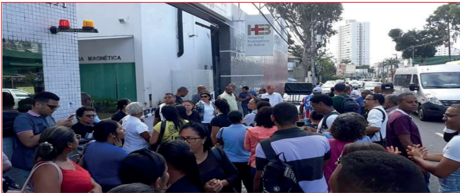
Hospital Evangélico da Bahia

2020: um ano marcado pela dor, medo e desrespeito aos trabalhadores