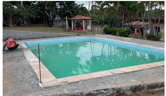
Chácara Sindisaúde em obras