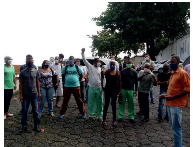
Hospital Bom Viver