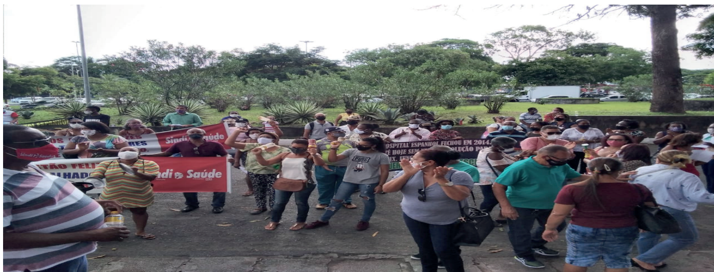
Ex-Trabalhadores do Hospital Espanhol