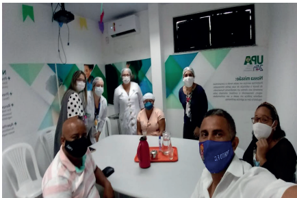
UPA São Cristóvão

Durante a campanha salarial trabalhamos duro, lutando incansavelmente nas mesas de negociações para garantir um reajuste de salário e a manutenção dos direitos conquistados. Diante dos impasses e sem conseguir fechar acordo, pedimos a intervenção do Ministério Público do Trabalho e na impossibilidade de nos reunirmos presencialmente participamos de várias audiências online. Com o Sindhosba e Sindifiba conseguimos, enfim, assegurar todas as nossas conquistas por mais dois anos e 2% de reajuste (sobre o salário de agosto a partir de 1º de novembro de 2020, enquanto o retroativo de agosto a novembro seria pago em três parcelas: janeiro, fevereiro e março de 2021). Já com o Sindhosfeira, foi possível manter todos os direitos conquistados anteriormente e 2% para trabalhadores lotados em hospitais e 4% para aqueles que trabalham em consultórios médicos e clínicas ambulatoriais; além de ganhos superiores à CLT. Apesar de o acordo estar longe do que realmente a categoria merece e precisa, tenham certeza de que lutamos o quanto podíamos a fim de alcançarmos o melhor resultado. Neste momento pandêmico, de recessão da economia e constante ameaça de demissão em massa fizemos o que pôde ser feito. Era isso ou nada.